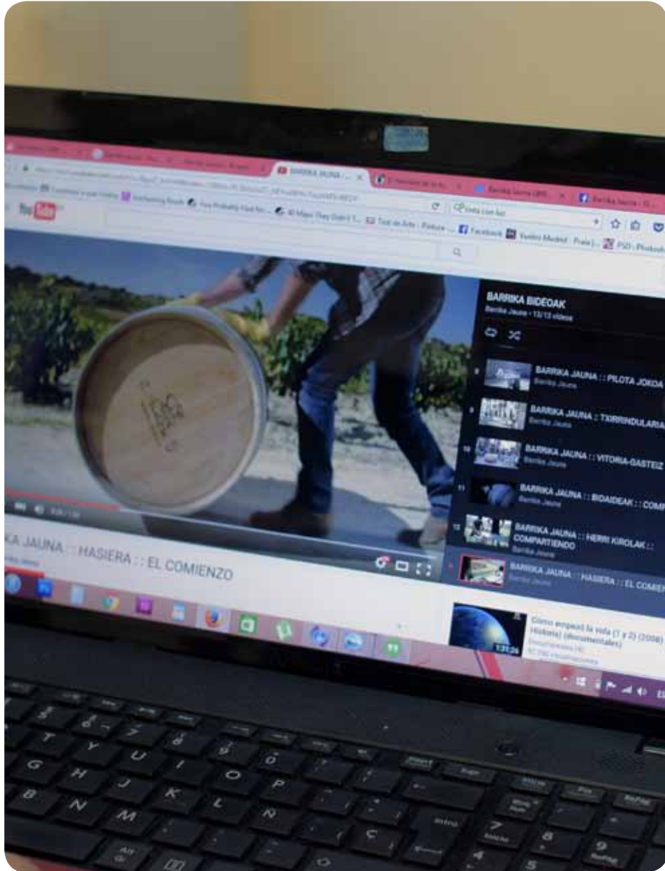
Canal Youtube Barrika Jauna