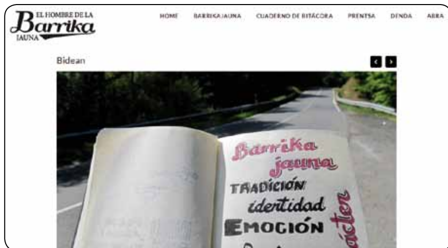
Web Barrika Jauna