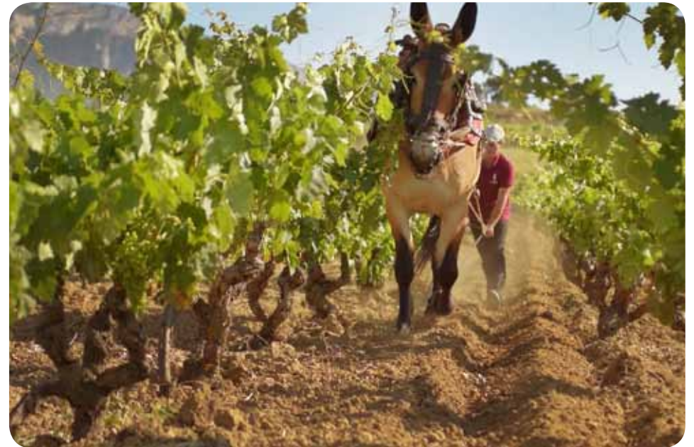
Fotogramas de los nuevos capítulos de Barrika Jauna, 2016